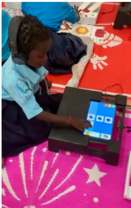
Førskolebarn i ivrig «lek» med bokstaver og tall